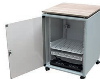
Platte EICHE SONOMA