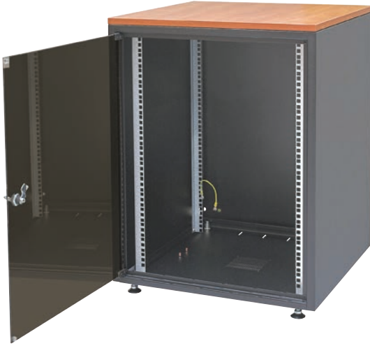
SJB-Schrank mit einer Höhe von 15 HE im Farbton RA L 9005