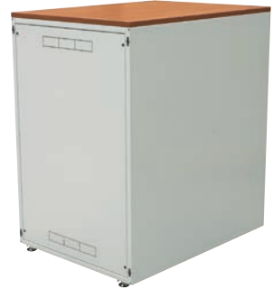
SJB-Schrank mit einer Höhe von 18 HE im Farbton RAL 7035